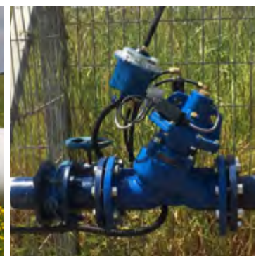
CONTROL DE CAUDAL Y PRESIÓN