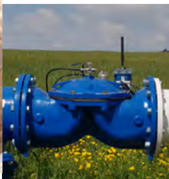
TRANSMISIÓN DE AGUA