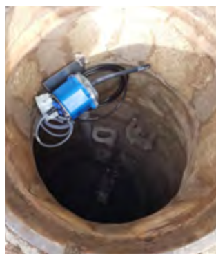
CONTROL DEL NIVEL DE FOSA DE AGUAS RESIDUALES