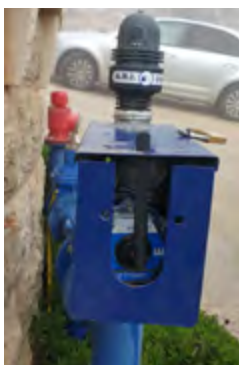
CONTROL DE TEMPERATURA